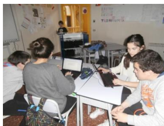
Aztarna ekologikoa kalkulaten